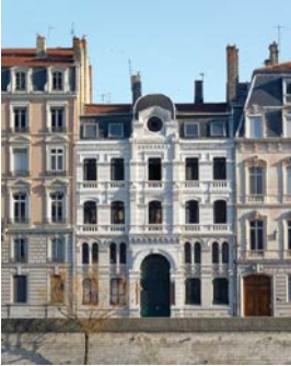
La Grande Synagogue de Lyon