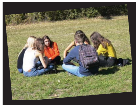
Journée 'Ethique et Management' en Hypokhâgne : discuter ensemble les cas d'éthique...

«Une chose que j'ai aimée : partager ses idées avec d'autres». Une élève du Lycée professionnel, lors d'un temps fort de réflexion.