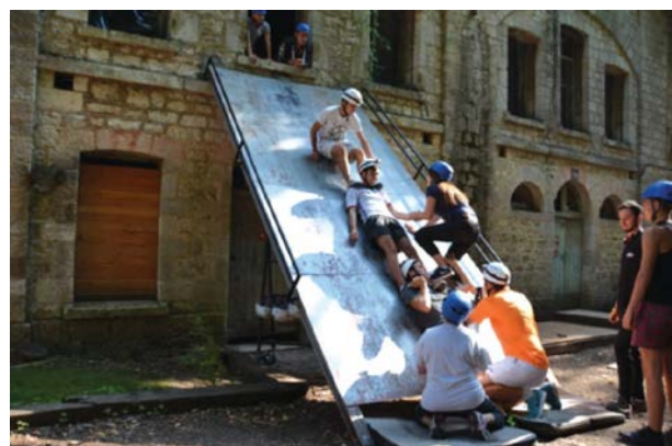
Journée d'intégration des BTS : avancer ensemble !